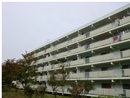
1号棟南面改修工事施工前