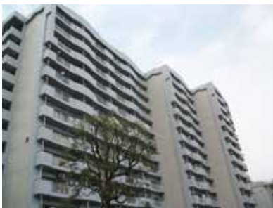
都営多摩ニュータウン 向陽台団地（3号棟）