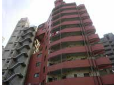
シルバーパレス目白