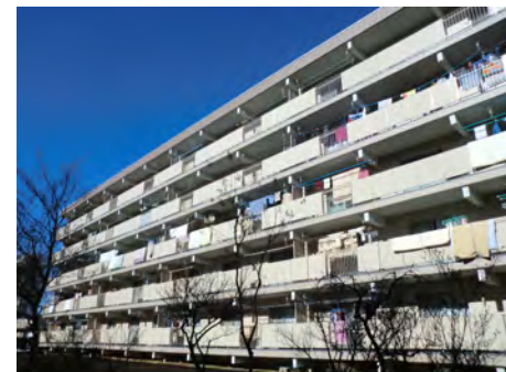
1号棟南面改修工事施工後