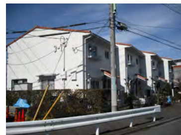
つつじ野団地低層棟施工後