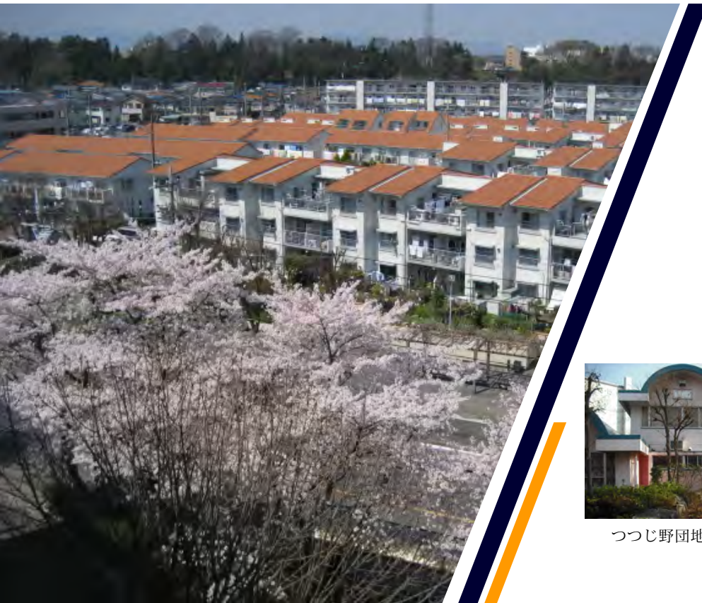
つつじ野団地外壁等改修工事 全1004戸