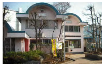
つつじ野団地付属棟（施工前）